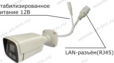
Рис. 1 Схема подключения видекамеры